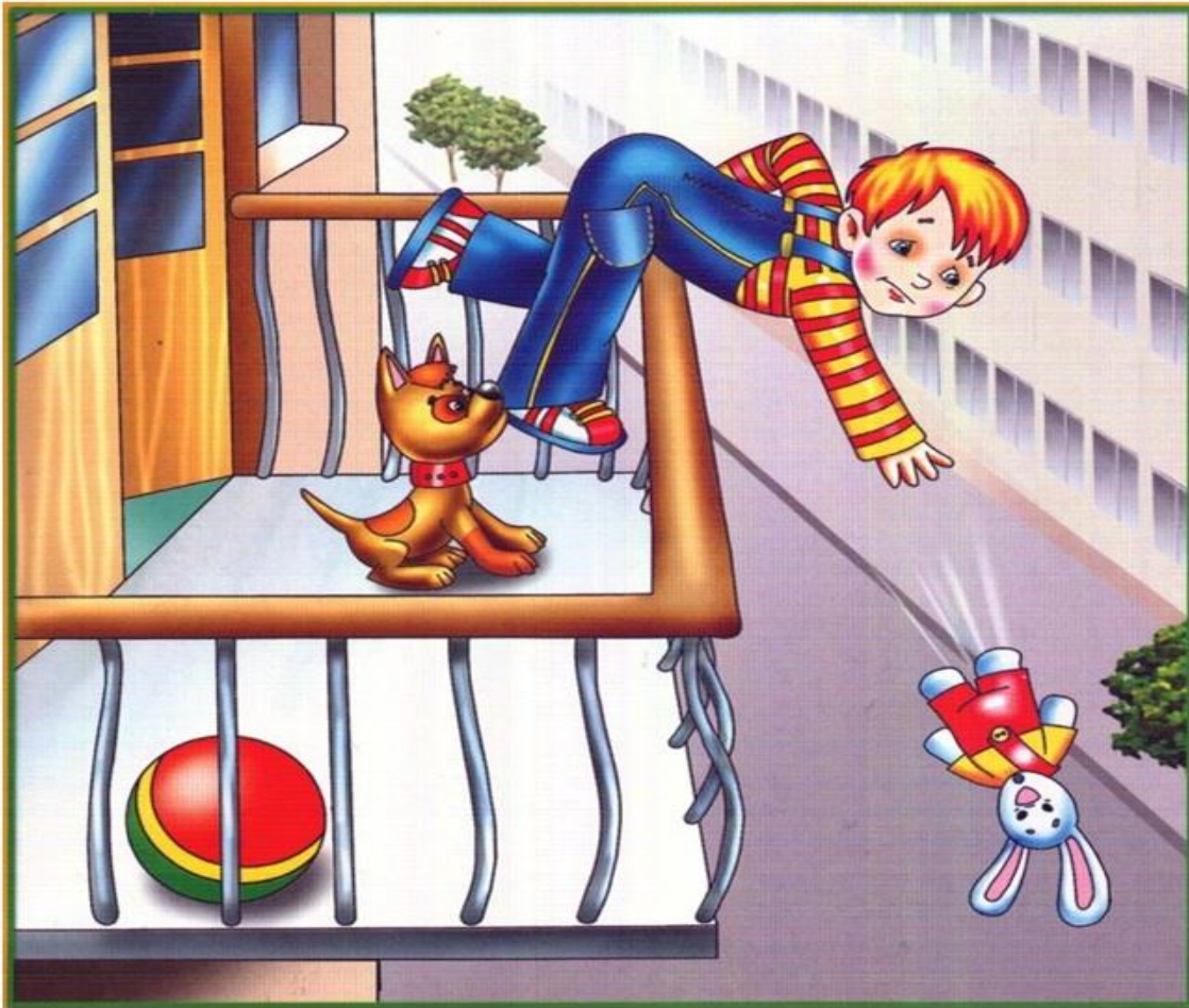
Правило №4 «Нельзя играть на балконе».